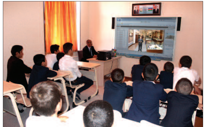
Şahbuz rayon Daylaqlı kənd tam orta məktəbi

Vurğulanıb ki, ötən dövr ərzində ölkəmizin bütün sahələrdə nail olduğu inkişafı Naxçıvan Muxtar Respublikasının təmsalında bütün çağırışları ilə görmək olar. Milli Qurtuluşun işığında böyük və şərəfli yol keçən qədim diyarımızda cəmiyyət həyatının bütün sahələrini əhatə edən gənişmiqyaslı islahatların, dövlət proqramlarının həyata keçirilməsinin nəticəsidir ki, Naxçıvan Muxtar Respublikası bu gün ən müasir məmləkətə çevrilib. Bu gün həyatımızın elə bir sahəsi yoxdur ki, orada Milli Qurtuluşun bəhrələri görünməsin.