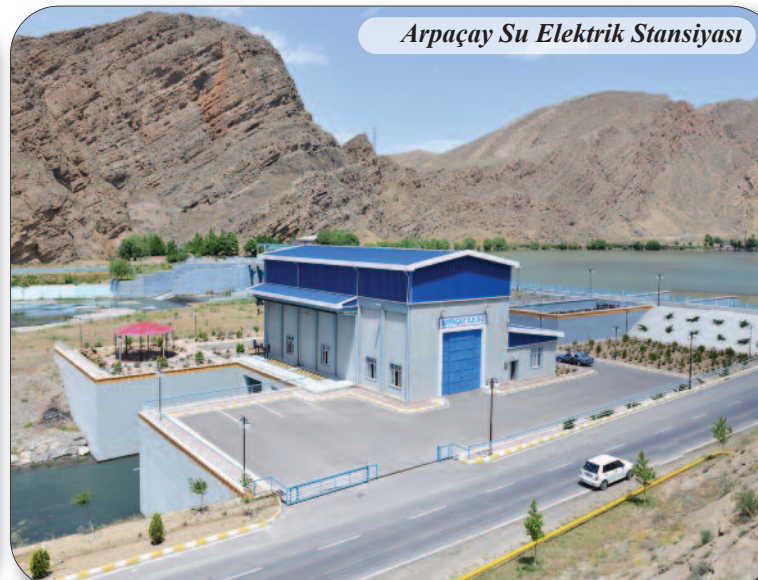
Arpaçay Su Elektrik Stansiyası