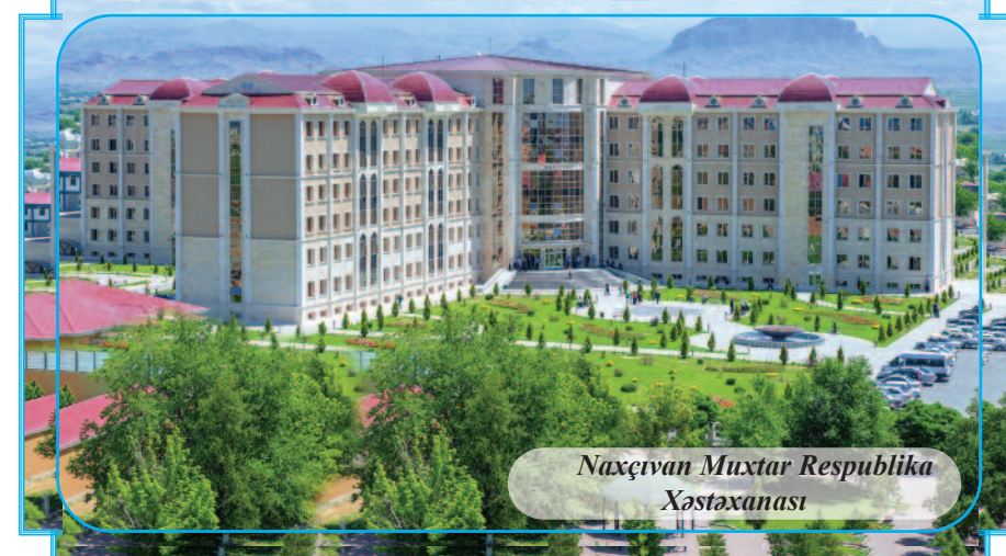
Naxçıvan Muxtar Respublika Xəstəxanası

Ətraf mühitin qorunması, təbii ehtiyatların mühafizəsi istiqamətində də mühüm işlər görülüb, yaşıllıqların artırılması diqqət mərkəzində saxlanılıb. Bu dövrdə 16 min