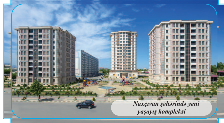
Naxçıvan şəhərində yeni yaşayış kompleksi

541 hektar sahədə meşəsalma və meşəbərpa işləri aparılıb, 10 milyona yaxın ağac və bəzək kolları əkilib. Hazırda muxtar respublikanın ümumi ərazisinin 12 faizini yaşıllıqlar əhatə edir. 1990-cı ilin əvvəllərində isə bu göstərici 0,6 faiz həddində idi.