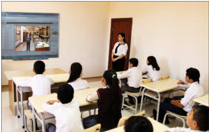
Şərir şəhər 1 nömrəli tam orta məktəb