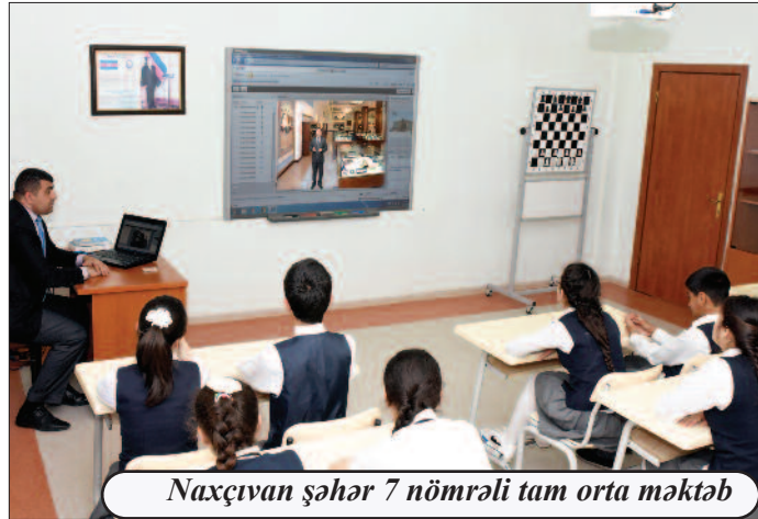
Naxçıvan şəhər 7 nömrəli tam orta məktəb