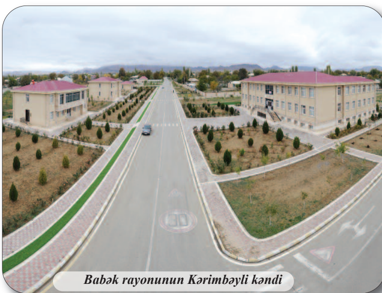
Babək rayonunun Kərimbəyli kəndi